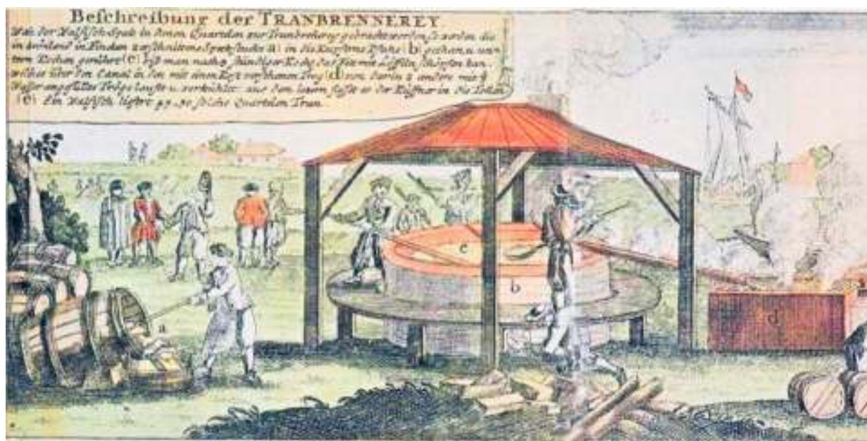
Trankogeriet så måske således ud).

var med til at opføre trankogeriet nord for Hjerting.